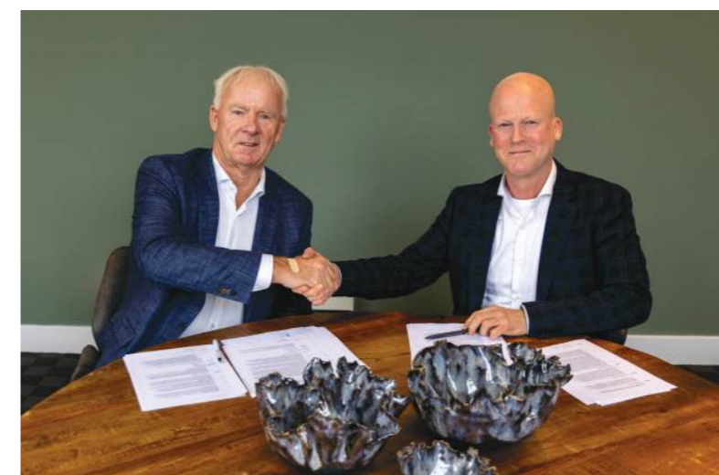
• De anterieure overeenkomst voor 23 woningen in Nij Beets is afgelopen december ondertekend