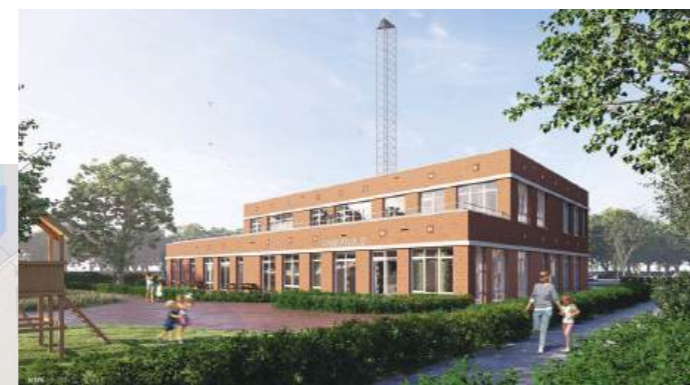
• De bouw van MFC de Finne is in januari 2026 gestart