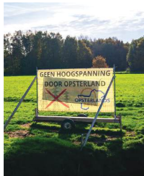
• Opsterlands Belang voert actie tegen hoogspanningslijnen, want er is een alternatief