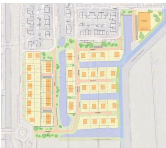
• Nu in Gorredijk Loevestein fase 4 Oost is volgebouwd, wordt gestart met het ontwikkelen van het aansluitende deel Loevestein fase 4 Zuid en fase 5 volgt daarna.