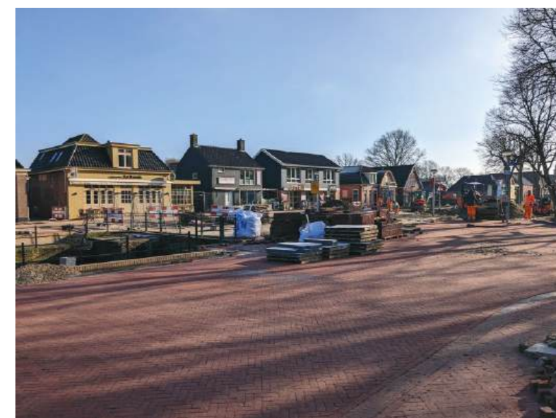
• De Brink in Bakkeveen is gerenoveerd